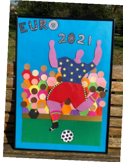
Une des réalisations de l'opération « Foot à l'école » (Classe CM2 de Mme Guilloteau)