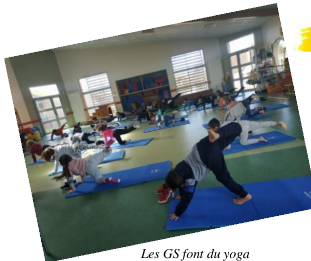
Les GS font du yoga