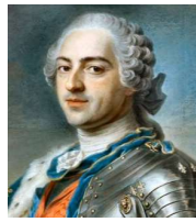
Louis XV règne de 1715 à 1774 et donne le pouvoir à son petit-fils