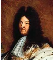
Louis XIV règne de 1643 à 1715 et donne le pouvoir à son arrière-petit-fils

Nous avons étudié la formation de la monarchie absolue avec le personnage historique Louis XVI. Lorsqu'il est mort, il a laissé la place à son arrière-petit-fils Louis XV qui n'avait que 5 ans ! Rien ne change beaucoup pendant son règne. Quand Louis XVI, son petit-fils hérite du pouvoir à 17 ans, Il retrouve un royaume appauvri et dont la société n'a pas évolué depuis des siècles et qui commence à élever la voix.