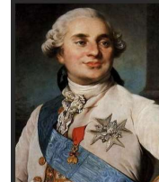
Louis XVI règne de 1774 à 1792. Il connaît deux règnes successifs.