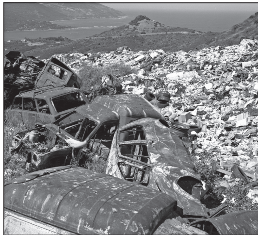
Doc. 5 Une décharge municipale en Corse.

Décharges saturées, poubelles pleines à craquer, détritus sur les plages, au bord des routes et en pleine nature : la Corse croule sous les déchets qu'elle ne parvient plus à traiter, le problème étant aggravé par la venue de millions de touristes en été. S'y ajoutent la multiplication des constructions et des déchets accompagnant les chantiers et une très forte consommation encouragée par la présence dans l'île du plus grand nombre de supermarchés de France par habitant. D'après Sciences et Avenir, septembre 2015.