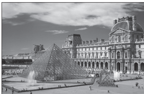
Doc. 5 Musée du Louvre à Paris.