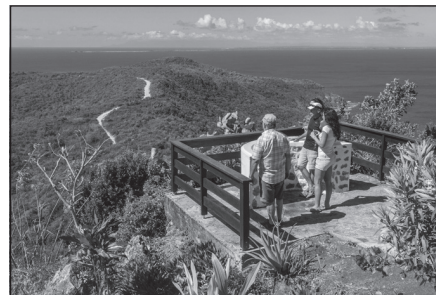
Doc. 4 Randonnée de touristes en Guadeloupe.