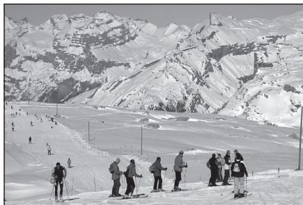
Doc. 3 Ski dans une petite station en Haute-Savoie : Flaine.