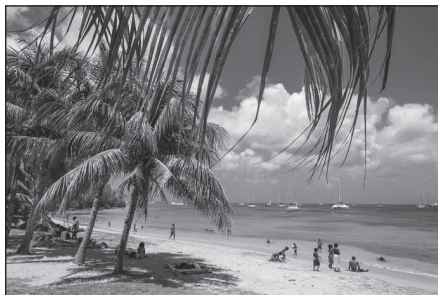
Doc. 2 Plage de la Martinique.