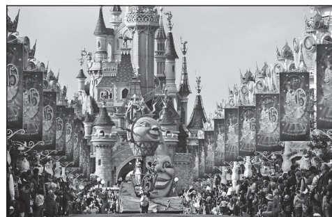
Doc. 6 Parc d'attraction de Disneyland Paris à Marne-la-Vallée.