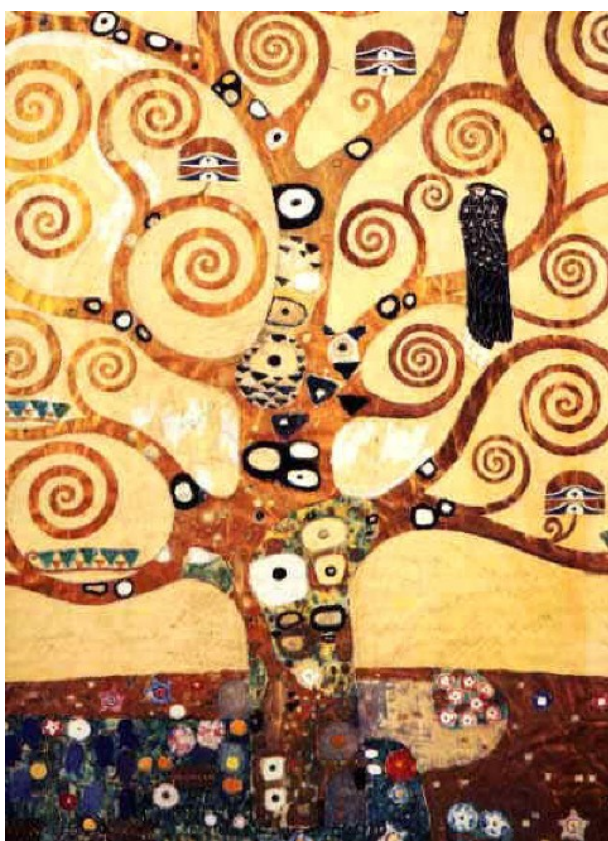
Gustav KLIMT, L'arbre de vie

Les laisser faire leurs propres commentaires, et leur demander ce qui est ressemblant (pareil) ce qui est différent, puis apporter les réponses attendues (...il y a des arbres, ils se ressemblent, ils sont tordus, les branches sont en forme d'escargot (spirale), c'est jaune ou marron, il y a des points entourés de toutes les couleurs, ...).