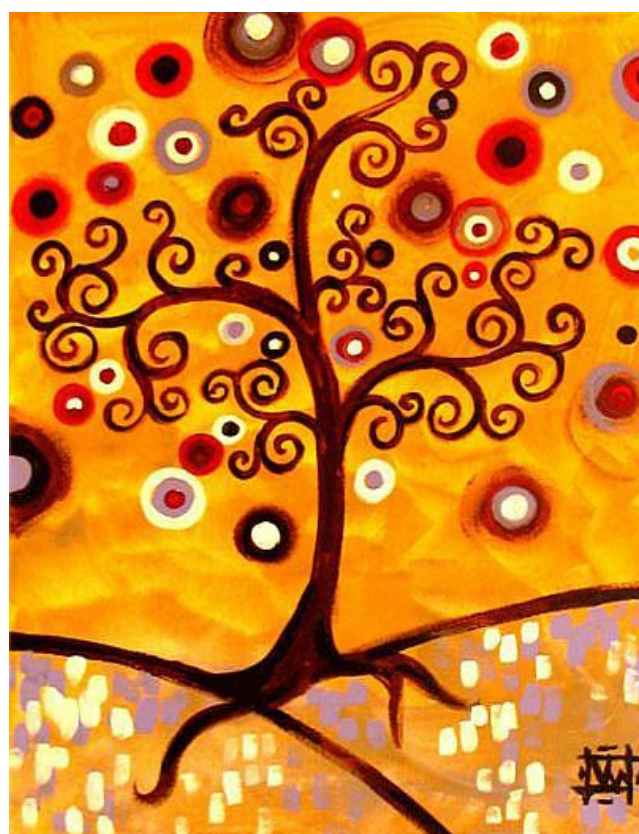
Natasha WESCOAT, Tree

2. Votre enfant va réaliser un arbre spirale à bijoux.