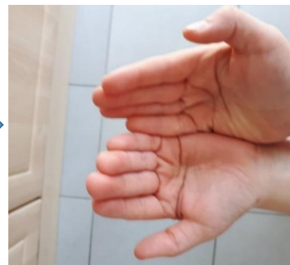
YOUPI ! J'ai les mains propres