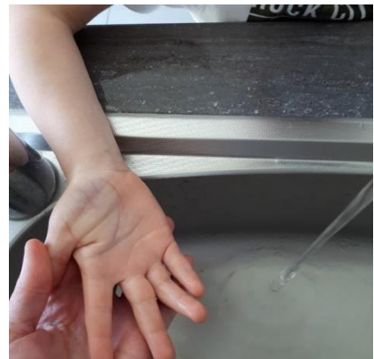
J'ai toujours du bleu sur les mains (microbes)