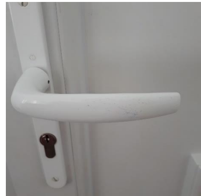
Ses microbes restent sur la porte.