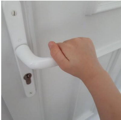
Lucas ouvre la porte.