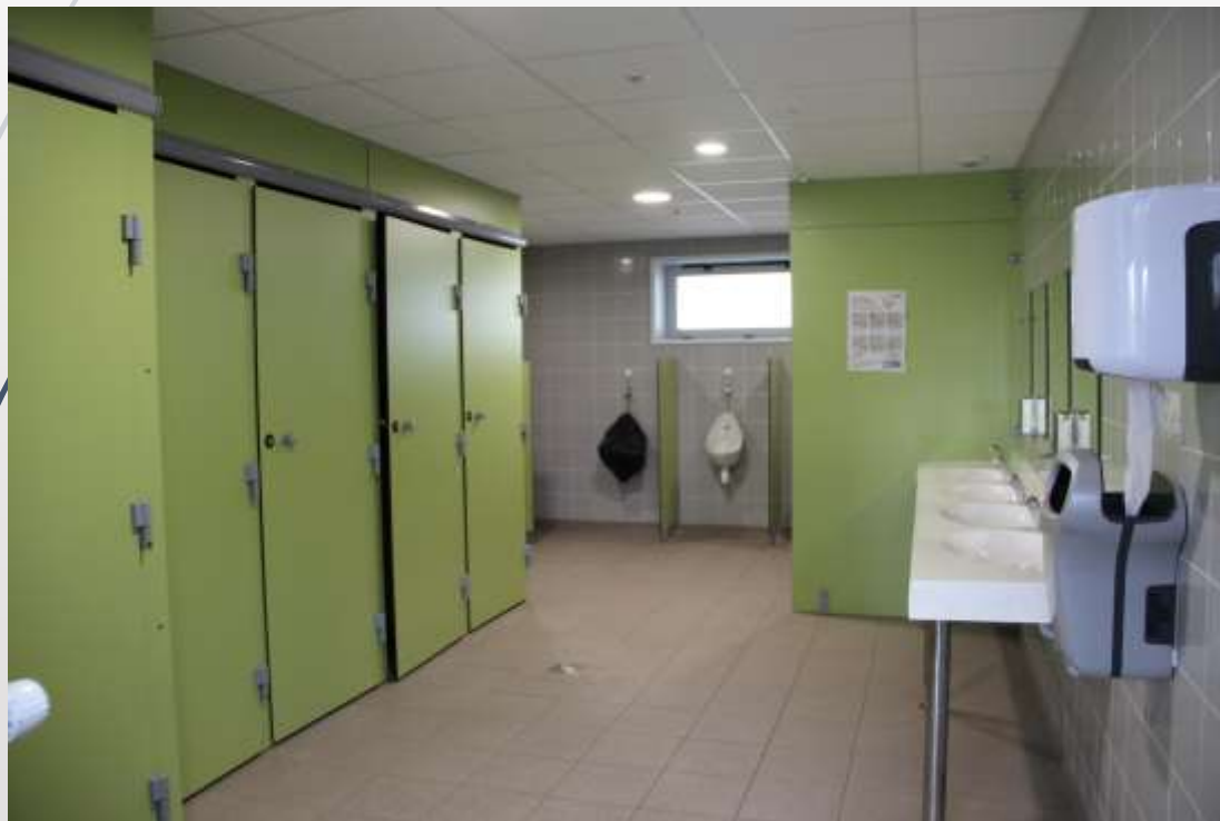
Toilettes des garçons