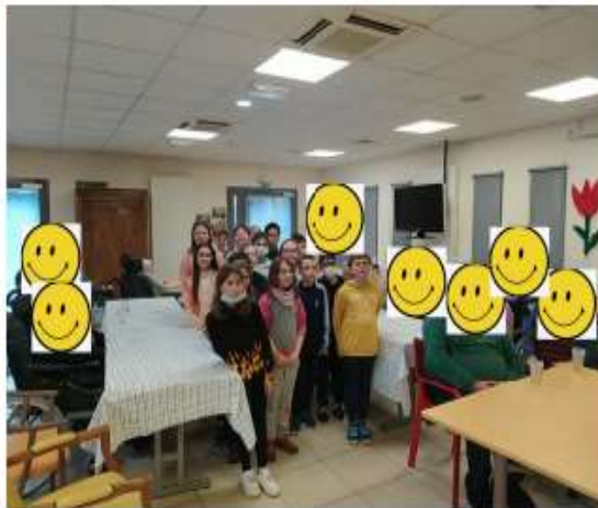
photo de la visite1

Présentation de nos œuvres artistiques pour qu'ils en choisissent 2. Ils pouvaient choisir entre art en ligne, Kandinsky, Matisse, Picasso, Le Corbusier et Pollock.