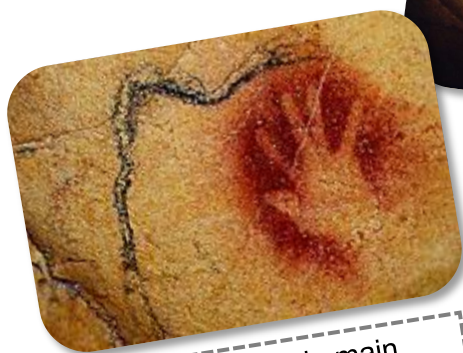
Empreinte de main