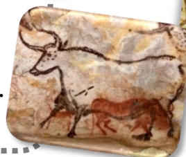
La grotte de Lascaux