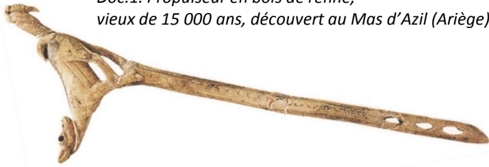
Doc.1. Propulseur en bois de renne, vieux de 15 000 ans, découvert au Mas d'Azil (Ariège)

Les archéologues ont étudié cet objet et ont cherché à quoi il pouvait servir. Ils pensent qu'il s'agit d'un propulseur qui permettait de lancer des flèches.