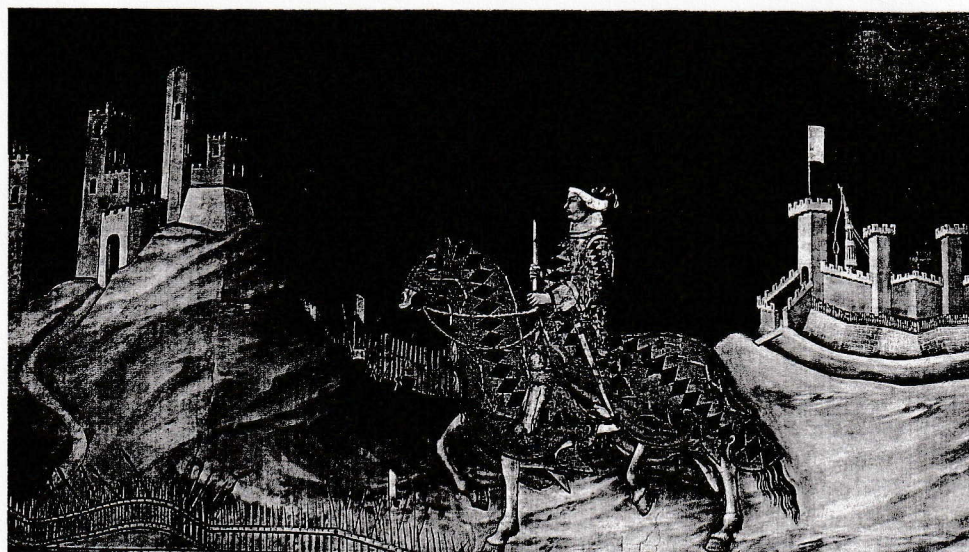
▲ Doc. 1 : Un seigneur italien, fresque de Simone Martini, Palais public de Sienne, 1328.

Au Moyen Âge, le chevalier apprenait à combattre à cheval avec une quintaine, mannequin pivotant qui envoyait un coup très violent dans le dos de celui qui le frappait maladroitement.