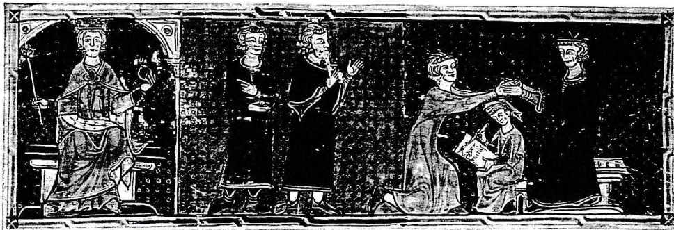
▲ Doc. 3 : Scène d'hommage au roi de France en 1304. Miniature, Les Grandes Chroniques de France , vers 1400.

À son tour, le seigneur qui a reçu un fief peut lui-même accorder des fiefs à d'autres vassaux.