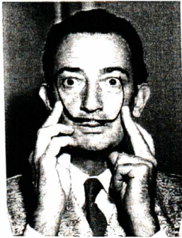
Salvador Dalí, 1953

Salvador Dalí naît en 1904 en Espagne. À six ans, il manifeste déjà un don pour le dessin.