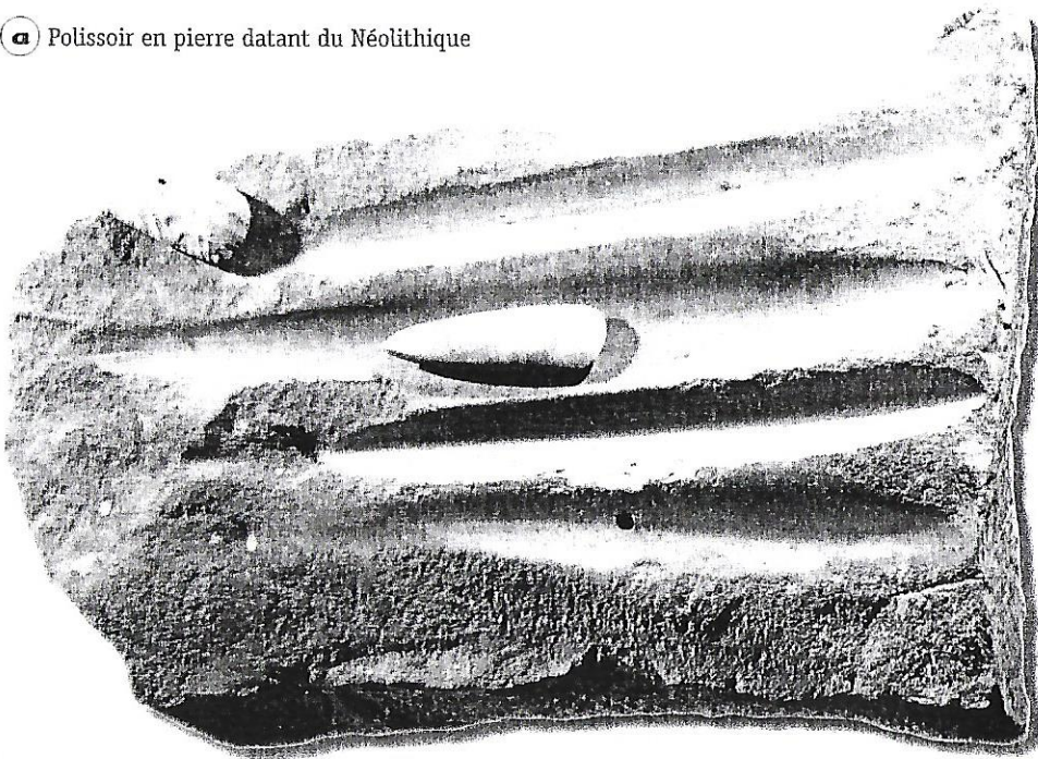
a Polissoir en pierre datant du Néolithique

A Parmi ces outils, entoure ceux qui sont polis et qui datent du Néolithique.