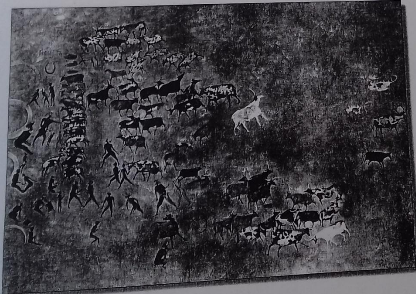
Peinture rupestre, Tassili, Algérie, -3 000 ans

A Observe la peinture rupestre et souligne la bonne réponse à chaque fois.