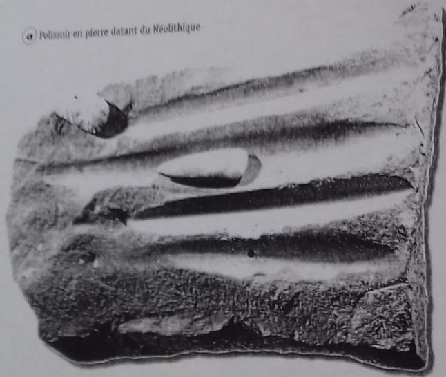
a Polissoir en pierre datant du Néolithique

A Parmi ces outils, entoure ceux qui sont polis et qui datent du Néolithique.